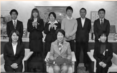
知事と受賞者との懇談