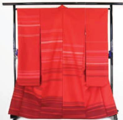
紅花先染め振袖「万葉からの誘」