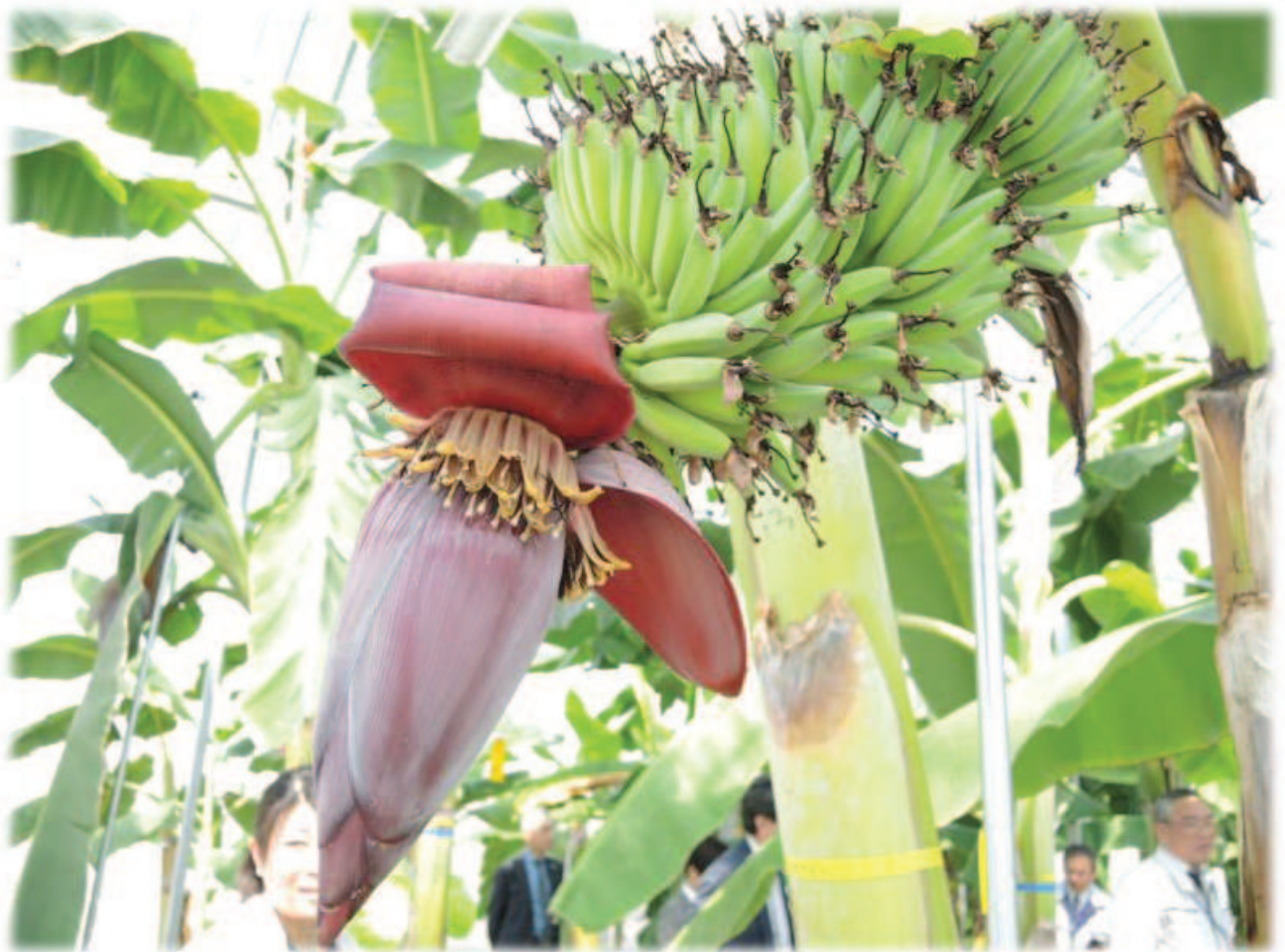
温泉熱を利用し栽培された東北初の国産バナナ「雪ばなな」（山形県戸沢村） （赤紫の花のような部分は苞葉と呼ばれるもので、その根元に連なる果指が一房のバナナとなります）