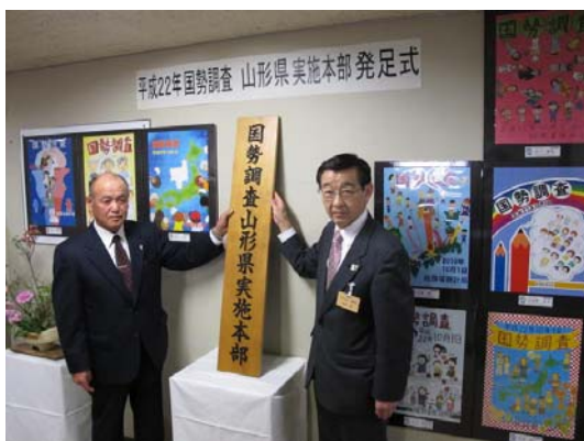
(写真) 高橋副知事と井上山形県統計調査員協議会連合会長が、実施本部の看板の掲示を行いました。

本年10月1日に実施される国勢調査を円滑に行うため、平成22年国勢調査実施本部(本部長：高橋副知事)を4月1日付けで設置し、本部の発足式を行いました。