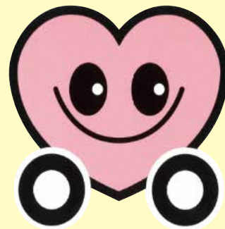
山形県交通安全シンボルマーク