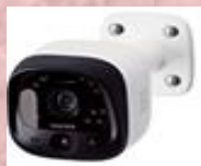
モニター付き屋外カメラ (監視+犯行を思いとどまらせる)