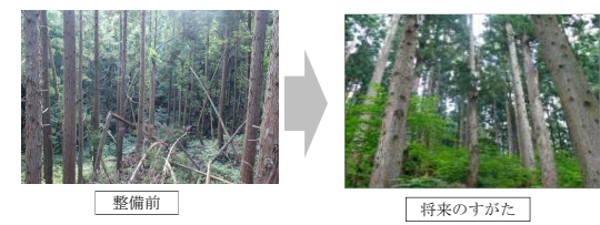
～多様な樹齢からなる森林が面的に整備され、公益的機能が持続的に発揮される森林へ～