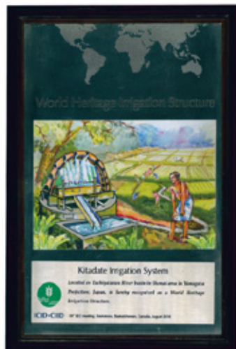
世界かんがい施設遺産登録楯