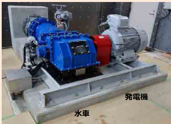
大井沢小水力発電所内

水力発電は、水が高いところから低いところへ流れる位置エネルギーを活用して発電するもので、水が流れる勢いで発電用の水車を回転させて、水車の回転を活用して発電機を動かすことで発電を行う。