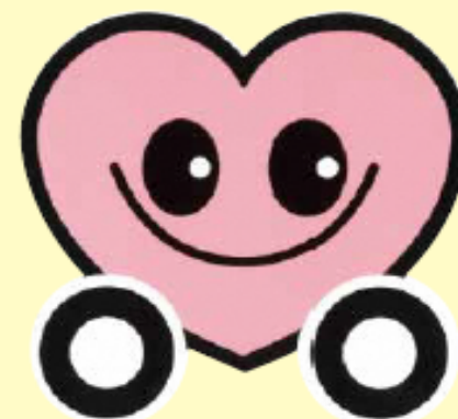
山形県交通安全シンボルマーク