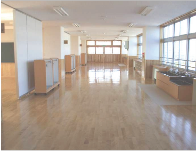
《教室前オープンスペース》内装に木材を積極的に使用した