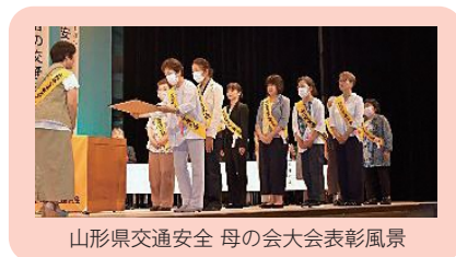
山形県交通安全 母の会大会表彰風景