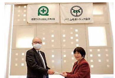
公益社団法人山形県トラック協会 置賜支部 様 より