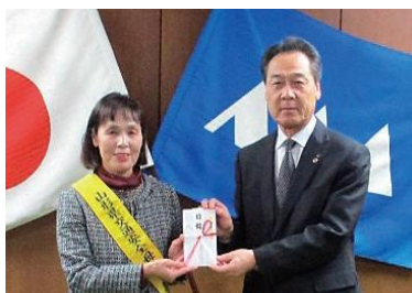
公益社団法人トラック協会 庄内支部 様 より