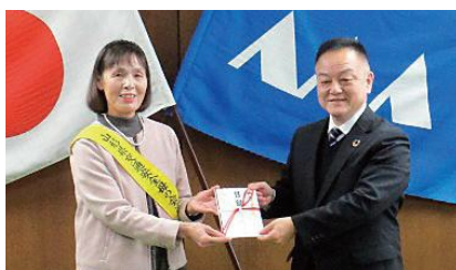
山形オートリサイクルセンター 株式会社 様 より