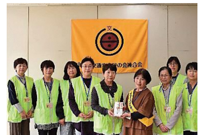
寒河江地区交通安全母の会 様 より