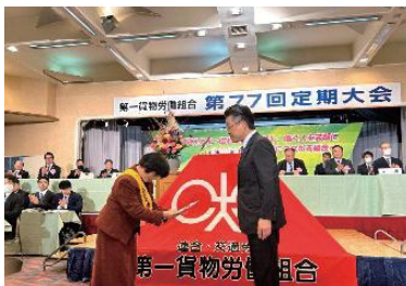
第一貨物労働組合 様 より