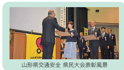
山形県交通安全 県民大会表彰風景

☆ 山形県交通安全母の会連合会长表彰(於:第41回山形県交通安全母の会大会 令和5年8月24日)