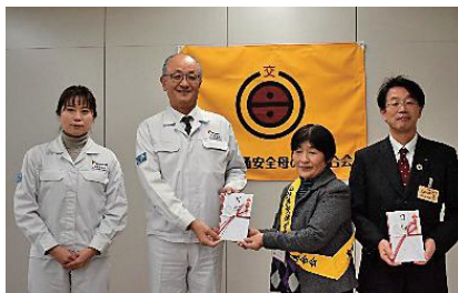
ミクロン精密株式会社 様 ミクロン精密株式会社輪の会 様 より