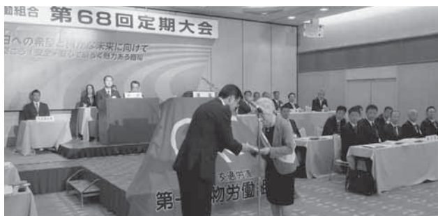
『第一貨物労働組合 様 (大会会場にて)』