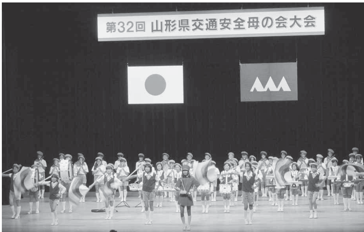
第32回山形県交通安全母の会大会（高島町文化ホールまほら）