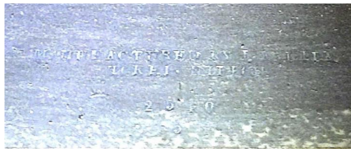
(銘) ANUFACTURED BY I.KANEDA / TOKEI NIPPON / 2540 / 5