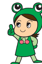
ケロちゃん 山形県消費生活センターキャラクター