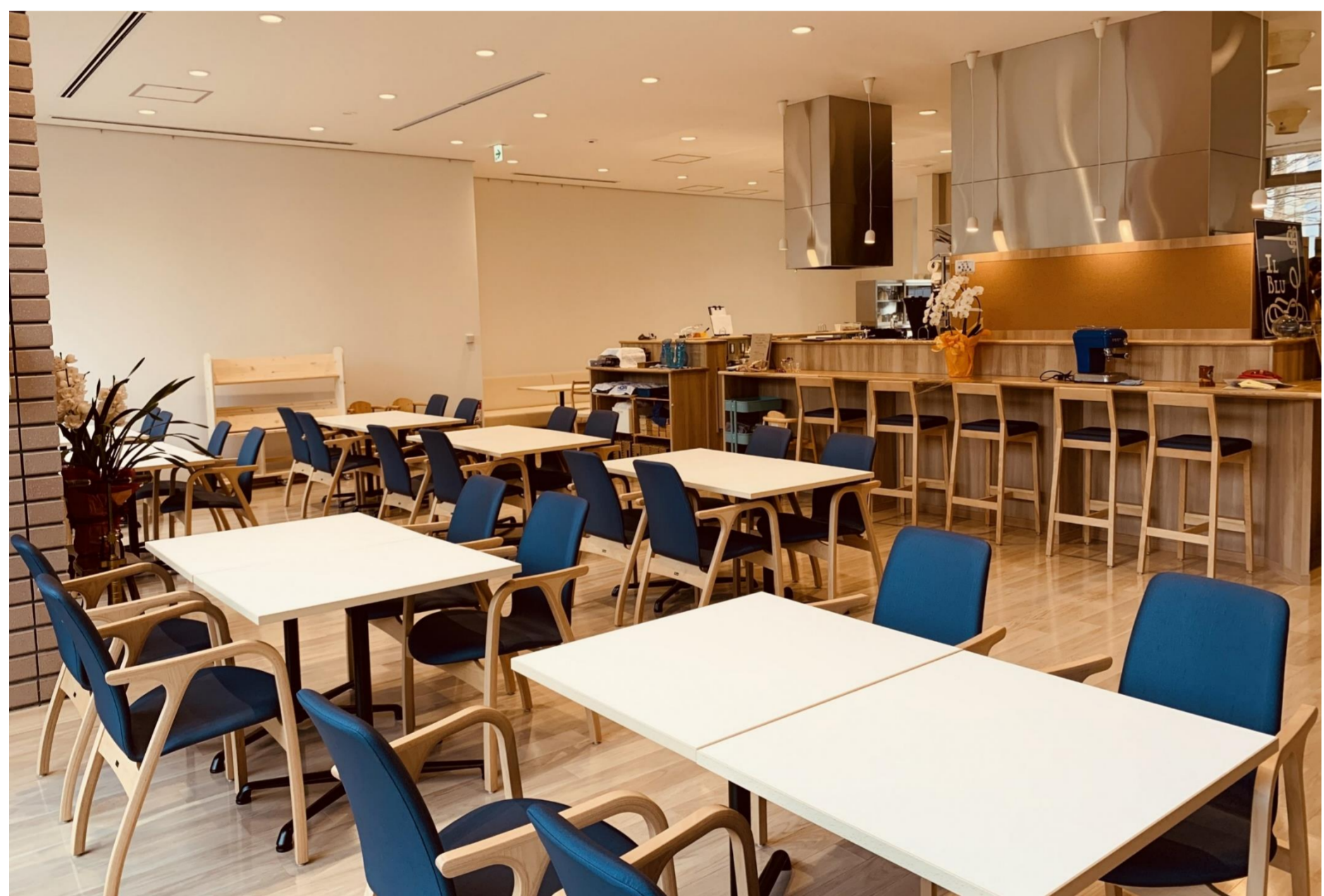
[カフェレストラン]

既存の喫茶店部分に、新たにカフェレストランとイートインスペースを増築し、飲食可能エリアを拡大しました。