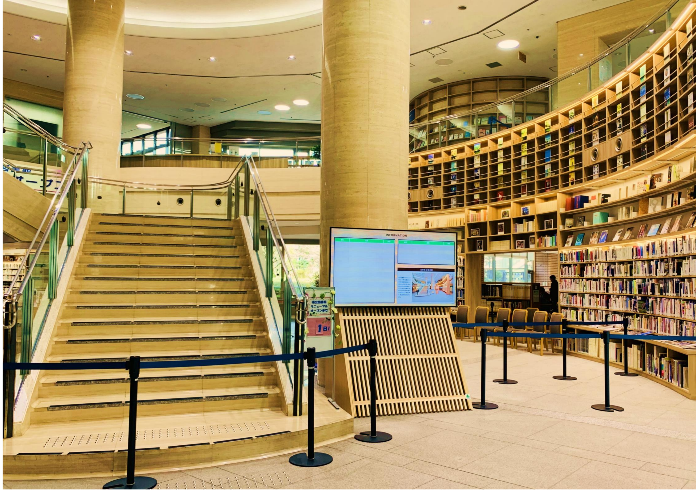
[エントランス・ロビー]

県立図書館の機能を拡大し、図書館を活性化させるために、内装の改修・書架の増設・レストラン増築を伴うリニューアル改修工事を行いました。図書館エリアを拡大し、蔵書数は18万冊から22万冊に、席数は180席から487席に増え、重厚感があった内装も一新されたことで、より県民に親しみやすい施設となりました。