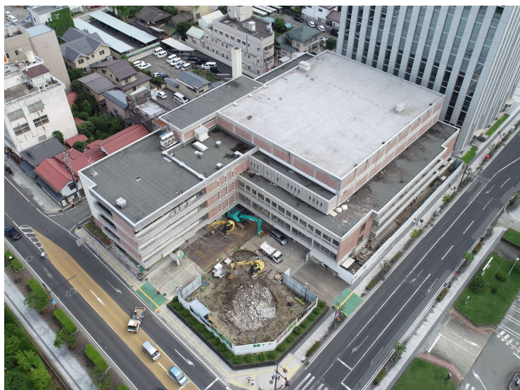
[着工前 (R4.7) ]

このため、周辺住民、往来者等の安全対策並びに工事箇所周辺の生活環境への配慮が特に重要な工事でしたが、事故等なく、無事工事を終了することができました。