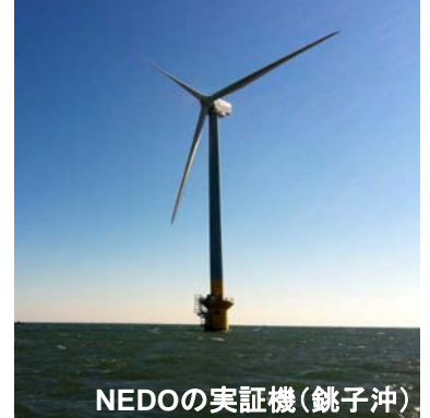
【洋上風力発電設備のイメージ】