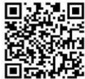
参加申込用QRコード