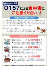
やまがたの食の安全ほっとインフォメーション(例)