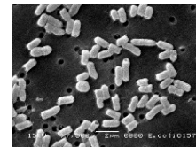
腸管出血性大腸菌の電子顕微鏡写真