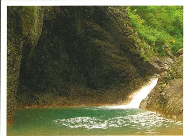
豊富な水流(竜ヶ滝)