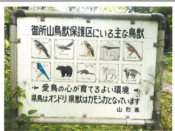
鳥獣保護区案内板(鳥獣)