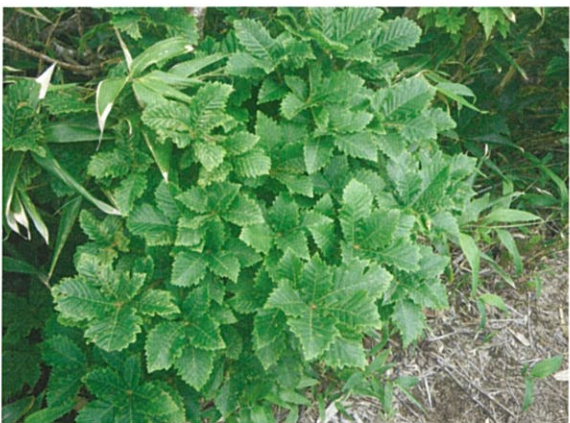
山頂付近ミヤマナラ