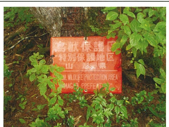
特別保護地区制札