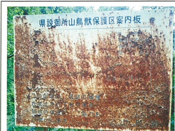
鳥獣保護区案内板(区域)