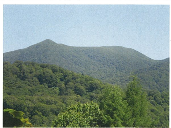
見晴らし台から見た御所山山頂 及び特別保護地区状況