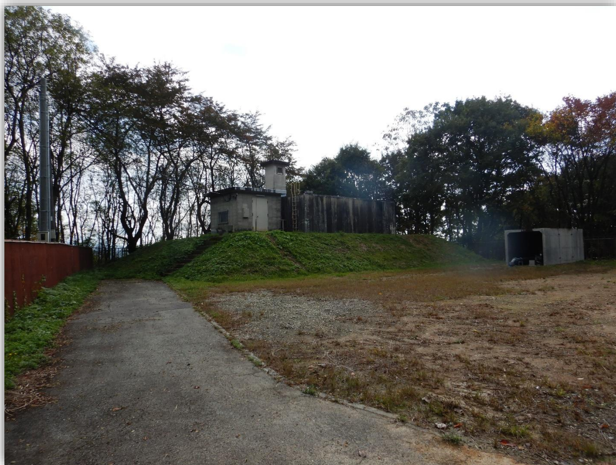
福田工業用水道 配水池及び第2取水井