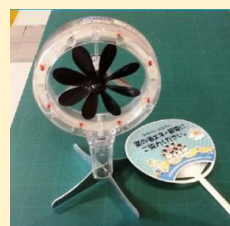
再生可能エネルギー 実験器（風力発電など）