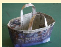
リサイクル工作 （新聞バッグなど）