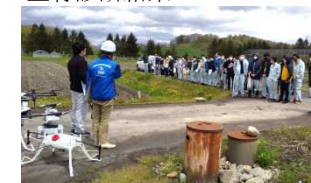
農林大学校でのスマート農業機械実演