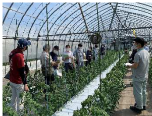
トマト「見える化」現地検討会(6/1)