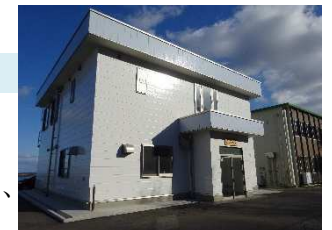
おいしい魚加工支援ラボ