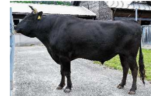
「福福照」号とモデル実証農場での調査状況