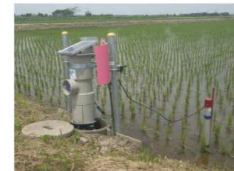
水管理省力化のための自動給水栓の設置