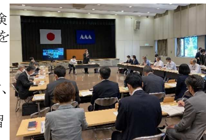
第1回山形県農業セーフティネット加入促進協議会