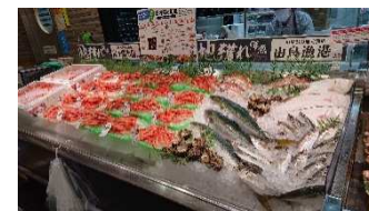
旬の魚キャンペーン