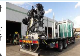
新たに導入したグラブプル付きトラック