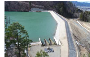
整備された農業ため池