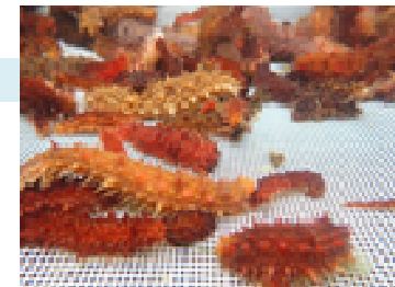
地場産ナマコの種苗生産技術開発