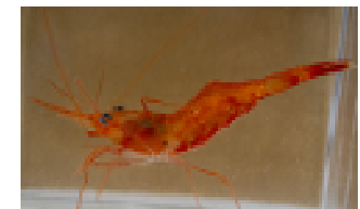
活エビ出荷技術開発