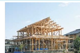
県産木材を利用した住宅への支援