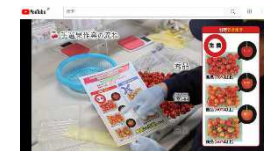
初心者にも分かりやすいさくらんぼ作業の動画配信