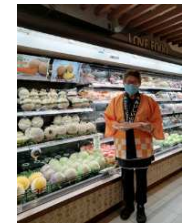
高級スーパーにおける販売プロモーション