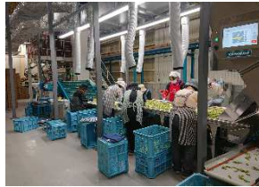
令和元年に整備された「JA全農山形おきたま園芸ST」