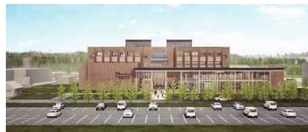
校舎外観イメージ図