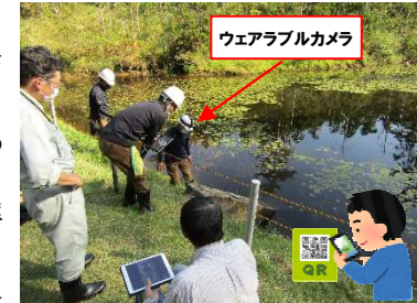
ICT技術を活用したため池点検