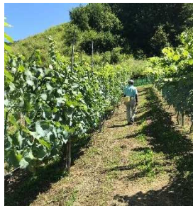
ワイン用ぶどう実証圃における省力性の検討(上山市小穴)