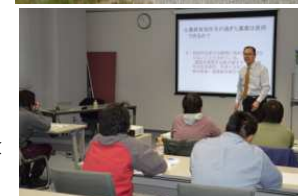
農業次世代人材投資資金受給者の研修