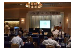
林工連携コンソーシアムでの研修会