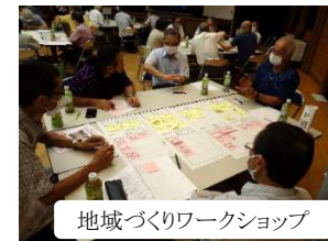
地域づくりワークショップ