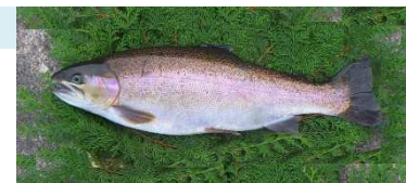
ニジサクラ種苗の生産