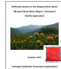
「最上流域の紅花システム」の申請書(表紙)