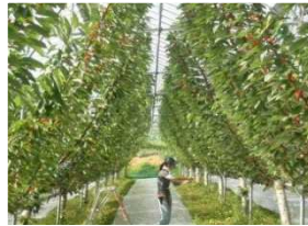
省力・軽労的な仕立て方(V字)