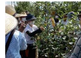
りんご早期成園化のための栽培研修会