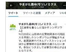
ツイッターでの情報発信