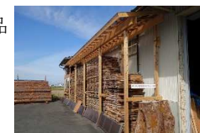
広葉樹の保管施設