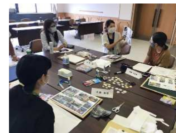
次世代リーダー育成セミナー