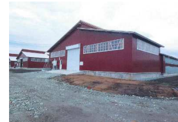
畜産クラスター事業で整備した牛舎