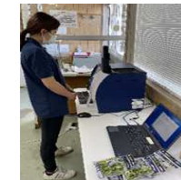
今年、県内生産組織が枝豆の光センサーを独自に導入