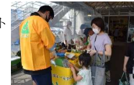
オーガニックファーマーズマルシェ