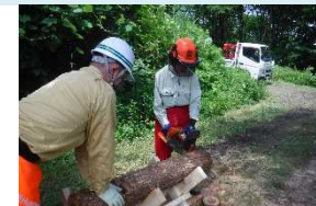
高校生対象のチェーンソー研修