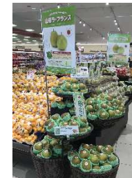
2年目となるGI「山形ラ・フランス」の販売