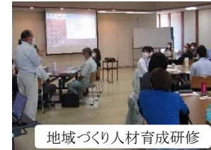
地域づくり人材育成研修