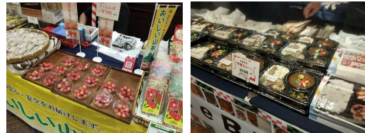
山形フェアへの出展状況