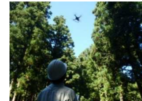
スマート林業研修会