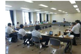
山形県再造林加速化対策会議