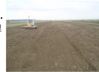
低コスト化・省力化に向けた基盤整備