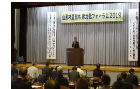
11月開催予定の「山形枝豆日本一産地化フォーラム」