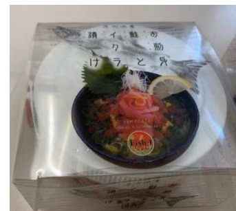
お刺身鮭とイクラ丼