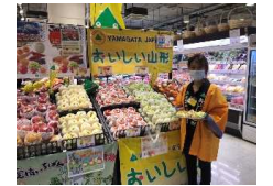
おいしい山形フェア