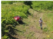
ラジコン式草刈り機による農地管理