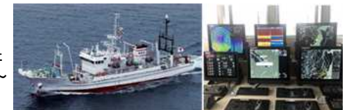
最上丸からのリアルタイム漁場データの共有化