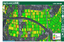
衛星リモートセンシング