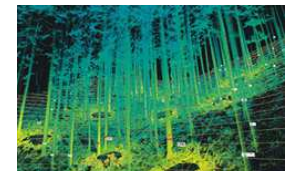
地上レーザー測量による間伐等の選木