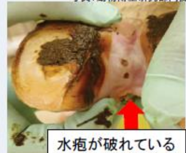
水疱が破れている