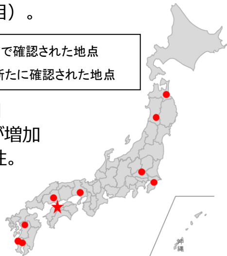
令和3年度 家きんの高病原性鳥インフルエンザの発生状況