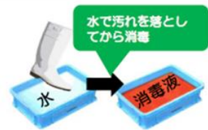
農場(畜舎)に出入りする際には、消毒を実施