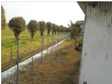
← 農場周辺に柵を設置