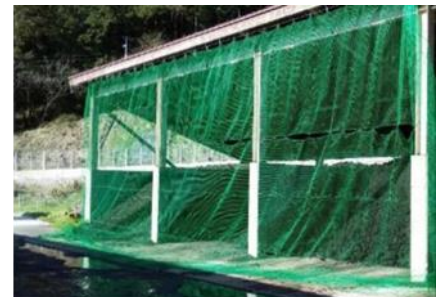
堆肥舎等への防鳥ネット設置→