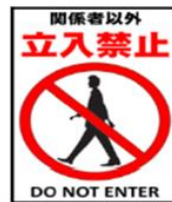
関係者以外の農場への立入を禁止