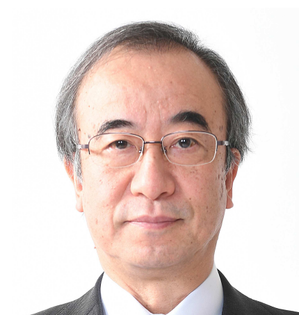
新潟県知事 花角 英世