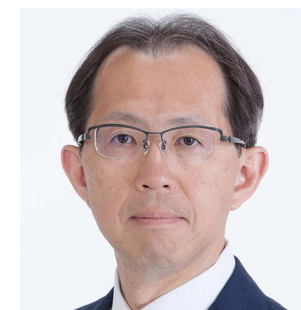
福島県知事 内堀 雅雄