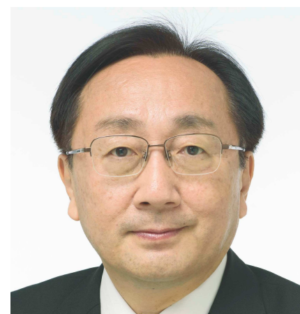
青森県知事 三村 申吾