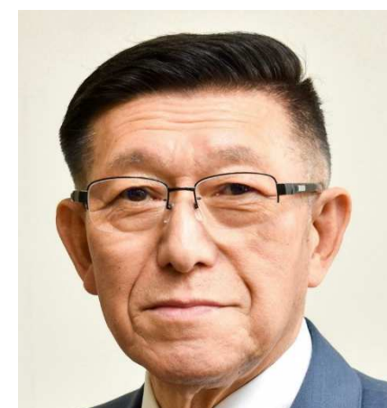
秋田県知事 佐竹 敬久