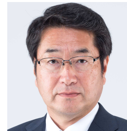
新潟市長 中原 八一