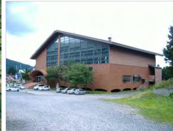
避難所(蔵王体育館)