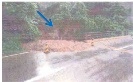
国道458号へ土砂流出(H23)