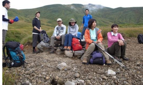
丁字分岐で寛ぐメンバー

扇子森でやはり水の少ない鳥海湖を眺めながら、いつものノンアルで乾杯&シャインマスカットのデ ザート付き昼食を済ませ、遥か下方へ伸びやかに続く木道を進み草紅葉の始まる千畳ヶ原へ。丁字分岐 でしばらく休んで臨戦態勢(^^;)を整え、いよいよ本日のメインイベント幸次郎沢に取り付きます。