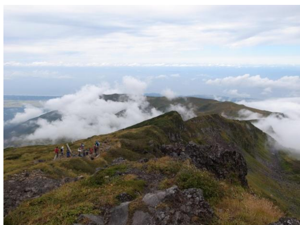
伏拝岳 ふしおがみだけ から西鳥海、日本海を望む

青空も覗くまずまずの天候のなか、八丁坂を行き 河原宿に近づくもいつもの沢音が聞こえず、「あれ最 近雨降ってないのかな」などと一瞬バカなことを考 えてしまいましたが、もちろん雪渓がなくなったた めです。このコースはこれまで数回歩いていますが、 水のない河原宿は初めての経験でした。