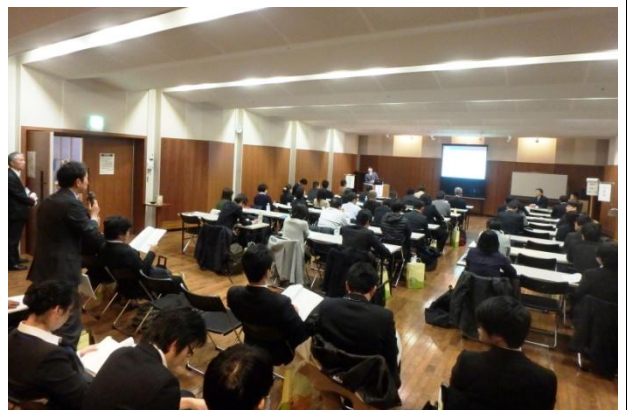
研究発表での質疑