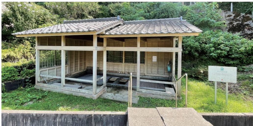
〔管理者・保全団体〕 湯野浜地区自治会