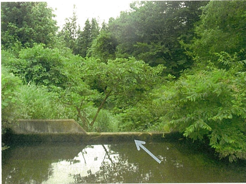
⑥ 既設の埋立処分場 下流部の沈砂池