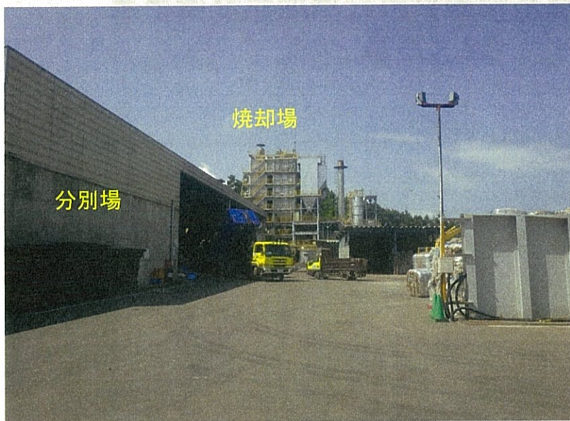
① 既存の施設 廃棄物の搬入状況