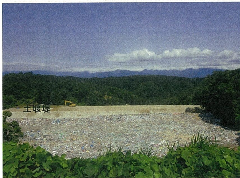
② 既設の埋立処分場 上流側から下流側を望む