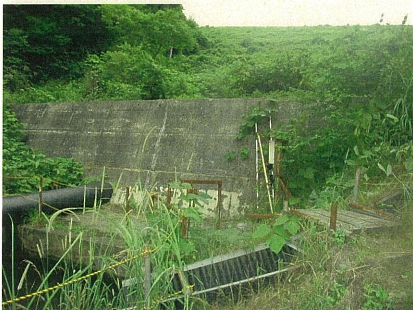
⑤ 既設の埋立処分場 下流部の擁壁