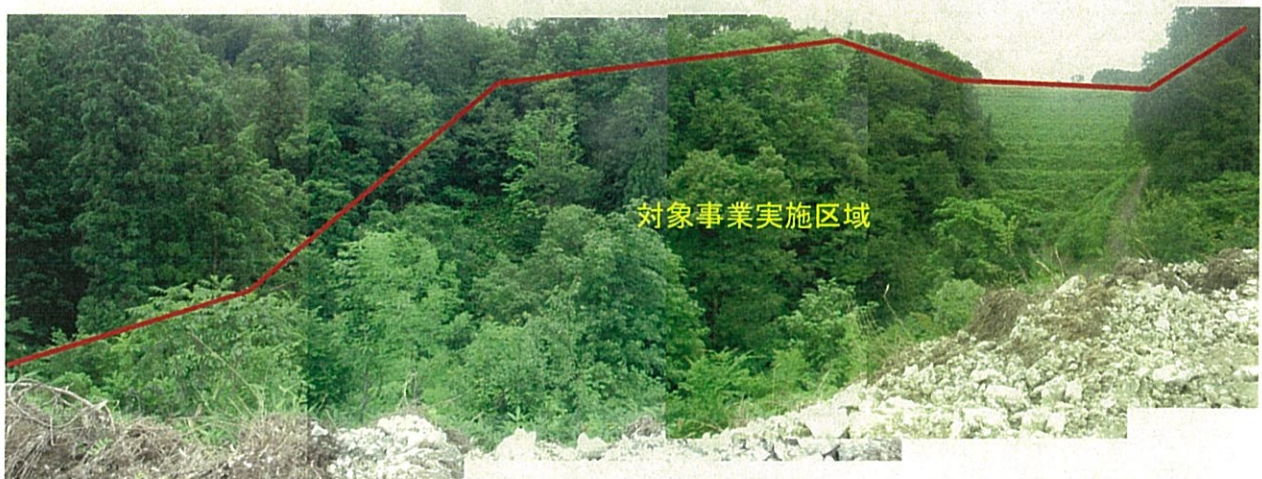
⑩ 埋立計画地 下流側から上流側を望む