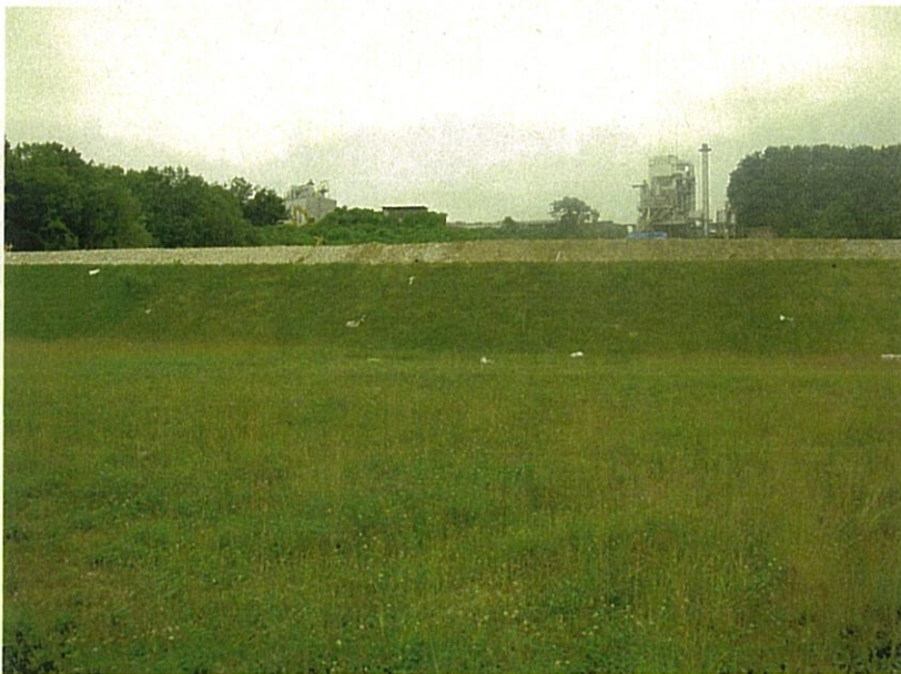
④ 既設の埋立処分場 覆土完了部分