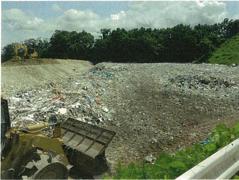
③ 既設の埋立処分場 下流側から上流側を望む