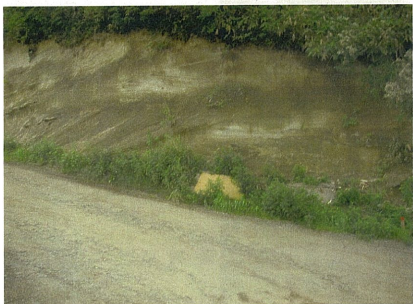
⑱ 切土の土質 (作業車道法面)