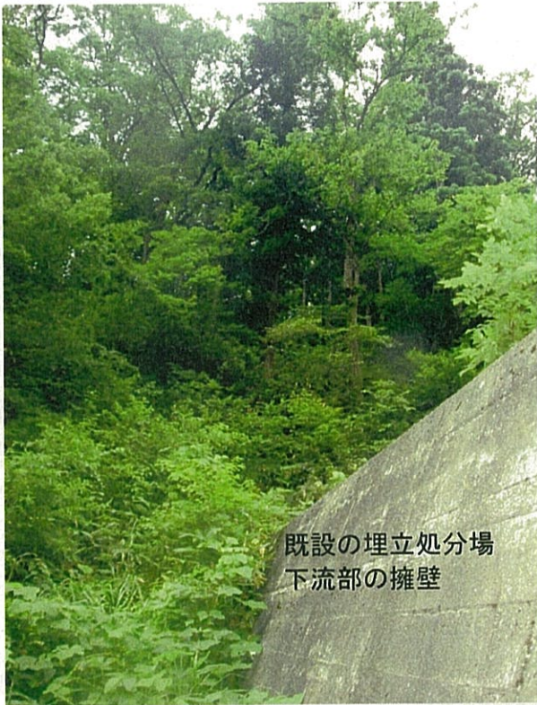
既設の埋立処分場 下流部の擁壁