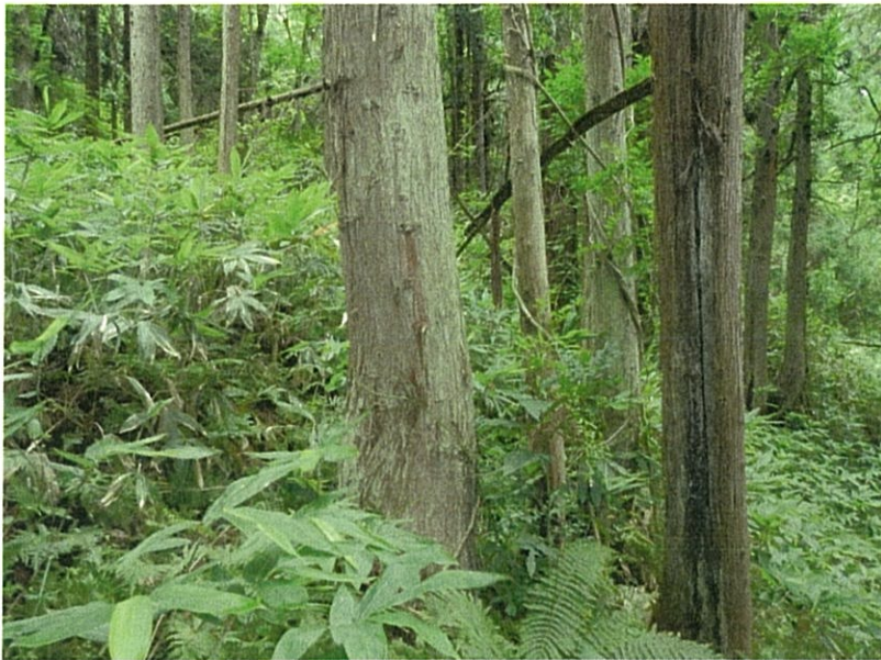
⑭ 針葉樹林の状況 (非改変部分)