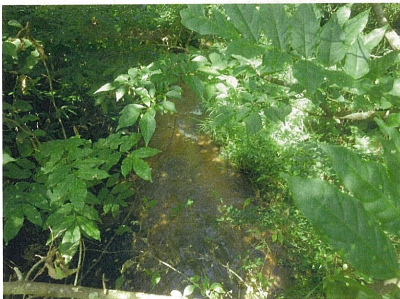
⑰ 鶯 沢