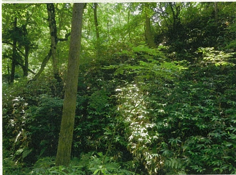
⑫ 広葉樹林の状況 (非改変部分)