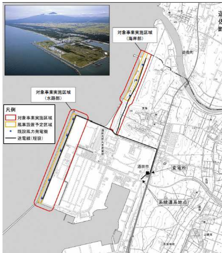
対象事業実施区域等