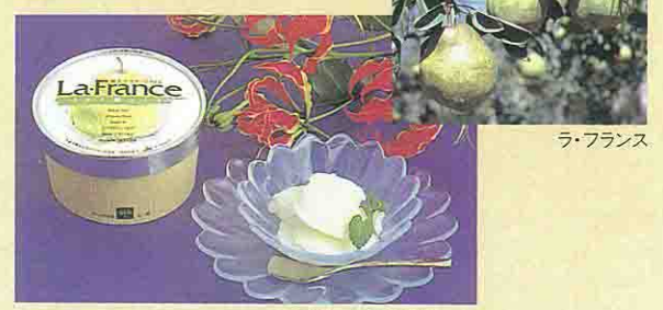
ラ・フランスアイスクリーム

JA天童が特産のラ・フランスを材料に、アイスとゼリーを開発した。ラ・フランスは、別名果物の女王とも呼ばれ、高貴な甘さは万人を魅了する。一見普通のアイスと変わらないが、一口食べると、優雅な味が口一杯に広がる。全国各地発送可。 JA天童フルーツセンター ☎0236-53-1177