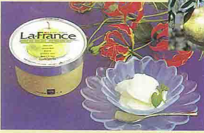
ラ・フランスアイスクリーム

JA天童が特産のラ・フランスを材料に、アイスとゼリーを開発した。ラ・フランスは、別名果物の女王とも呼ばれ、高貴な甘さは万人を魅了する。一見普通のアイスと変わらないが、一口食べると、優雅な味がお口一杯に広がる。全国各地発送可。 JA天童フルーツセンター ☎0236-53-1177