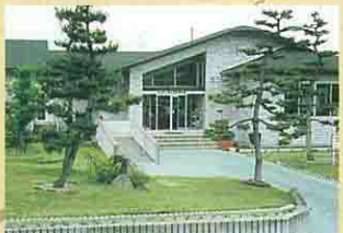
町立歴史民俗資料館

内陸型農耕資料のほとんどを収蔵し一堂に展示している県内唯一の資料館である。 また、1984年に重要有形民俗文化財に指定された「岩谷十八夜観音庶民信仰資料」や山形県史の古墳時代(後期)集落の代表的な遺跡「三軒屋物見遺跡」からの出土品の数々も展示されており、館の傍らには同遺跡の竪穴式住居が復元されている。 ・開館時間/9:30-16:30 ・休館日/毎週月曜日、祝日(一部を除く) ・観覧料/大人100円、学生50円、小・中学生30円 ◆お問い合わせ: 中山町立歴史民俗資料館 ☎0236-62-2175