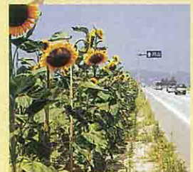
中山町の花「ひまわり」

毎年8月になると、国道112号沿いには、約4,000本ものヒマワリが目に咲きそろう。