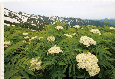
「残雪のころ」 大朝日岳・ナナカマド たかはし ひろゆき 高橋 浩幸 (真室川町)