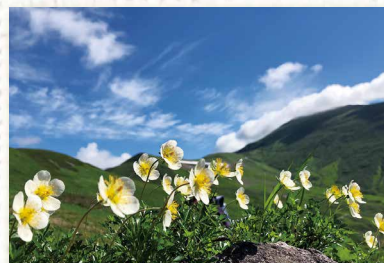
「可憐なチングルマ」 姥ヶ岳・チングルマ すずき あきとし 鈴木 昭利 (寒河江市)