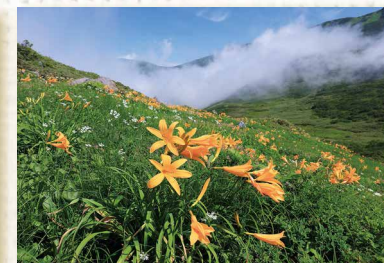
「鳥海の夏」 鳥海山・ニッコウキスゲ みうら かずき 三浦 一喜 (鶴岡市)