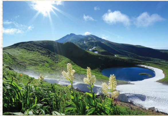
「爽やかな朝」鳥海山・コバイケイソウ とがし たつや 富樫 辰也 (山形市)

伝えたい魅力 御釜を見下ろすように咲くコマクサ群落。砂礫地に映えるエメラルドグリーン、淡いピンクが美しい。