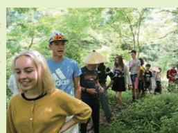
留学生と一緒に森を散歩中