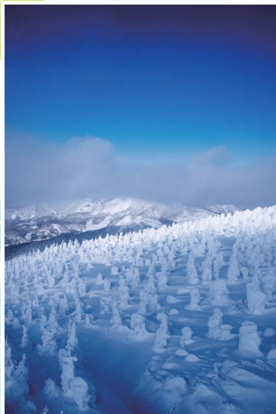
ロープウェイから樹氷群をのぞむ/蔵王