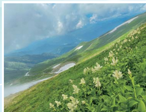
暑さ吹き飛ぶ景色/月山