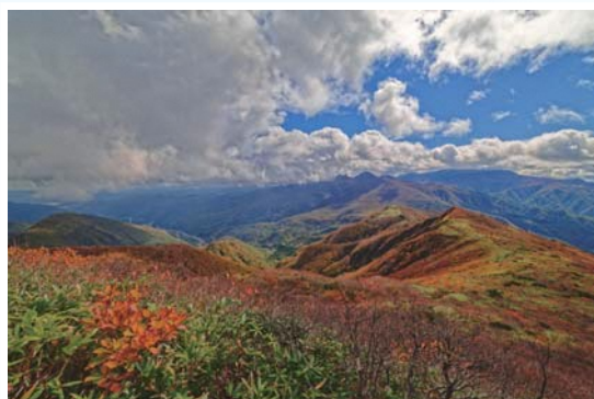
天上の楽園/山形神室岳