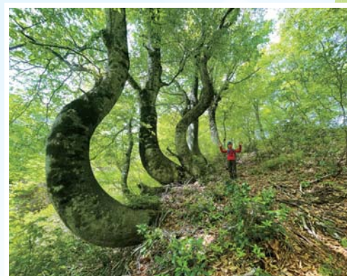
徳網山のブナ林