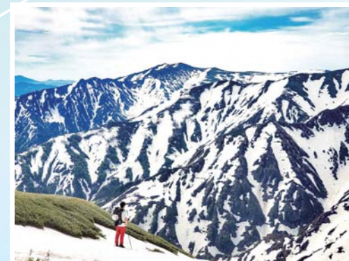
飯豊山 投稿者 keitagram_0705 さん