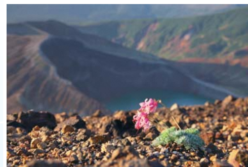
コマクサ咲く熊野岳