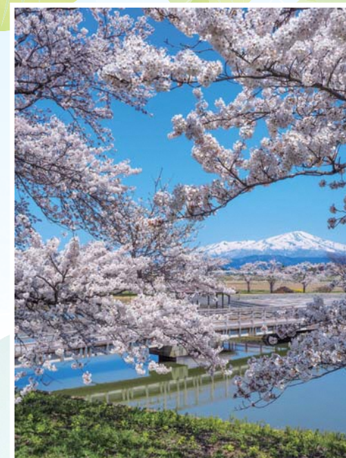
桜越しに眺める鳥海山