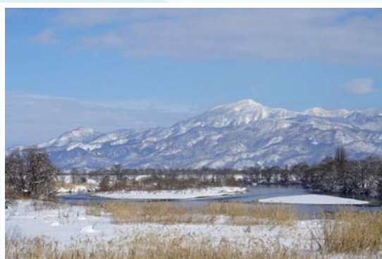
最上川と甑岳