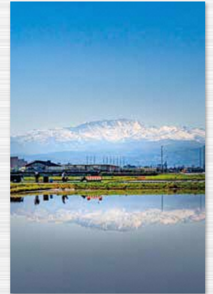
月山と田植え