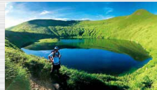
鳥海湖のリフレクション / 鳥海山