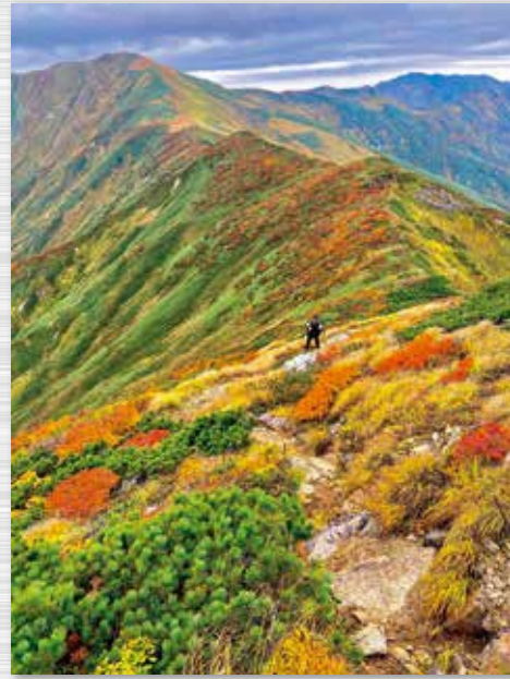
以東岳へと続く稜線