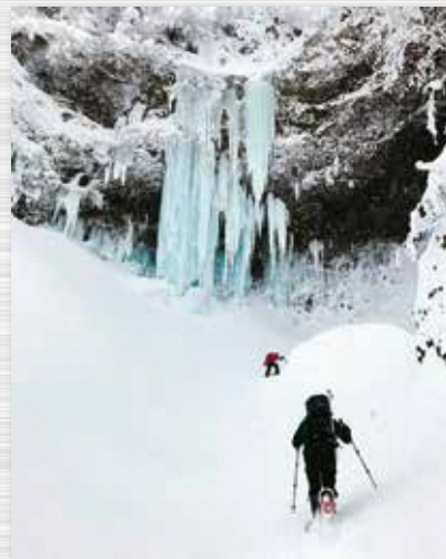
蔵王仙人沢氷瀑