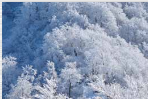
霧氷の中を歩く / 面白山