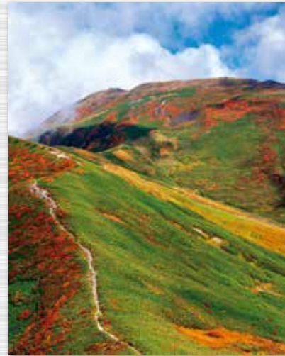
紅葉の月山