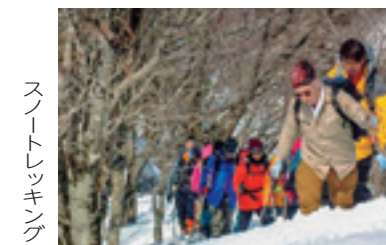
スノートレッキング