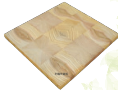
「かねやま杉 鍋敷き」 5名様