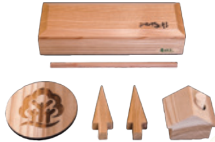
「山形県木製品セット」 5名様

☆正解者の中から「山形県木製品セット」を5名様、「かねやま杉 鍋敷き」を5名様にプレゼント！