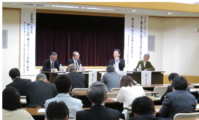
【美しい水と森のフォーラム（村山・置賜地域）(H27. 11. 26)】

「美しい水と森のフォーラム」及び「やまがた環境展 2015」で水資源保全のパネルを展示