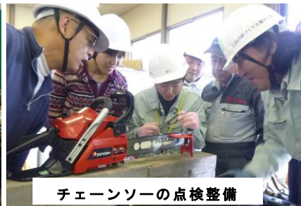
チェーンソーの点検整備