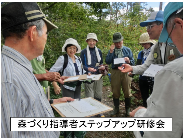
森づくり指導者ステップアップ研修会