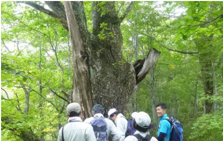
ギャップ形成から始まる奥山の天然更新

○奥山林と里山林の更新方法と人とのかかわりの違いを学ぶほか、森林活動におけるリスクマネジメントを実習する。