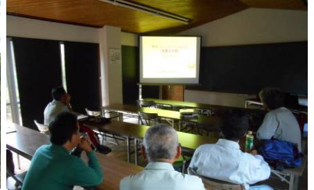
活動事故の対処法シュミレーション