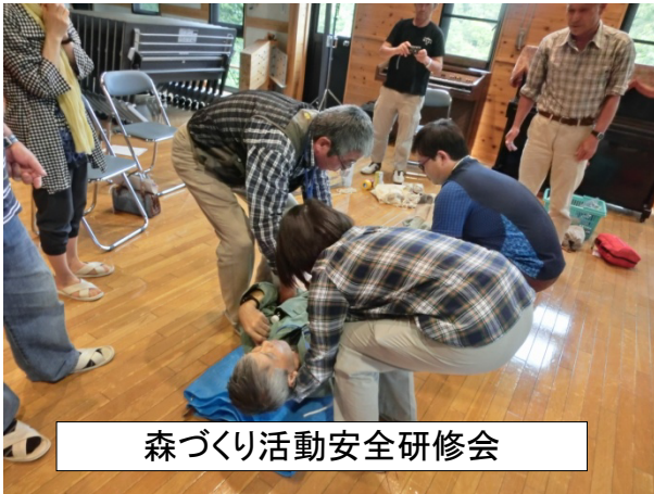
森づくり活動安全研修会