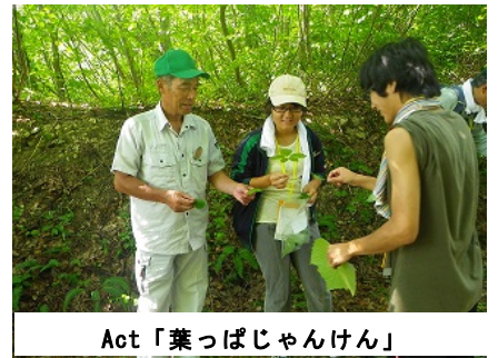
Act「葉っぱじゃんけん」