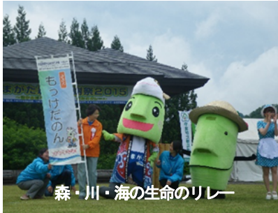
森・川・海の生命のリレー