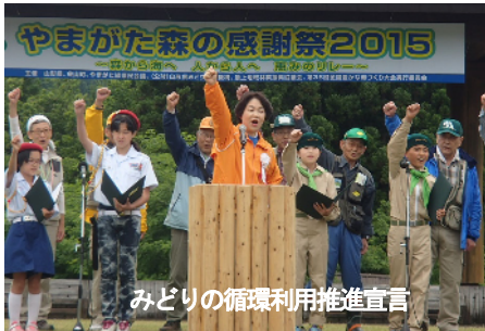
みどりの循環利用推進宣言