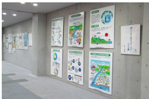
【美しい水と森のフォーラム（最上・庄内地域） (H27. 11. 24)】

「美しい水と森のフォーラム」及び「やまがた環境展 2015」で水資源保全のパネルを展示