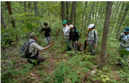
講義「森林環境教育のための森づくり」