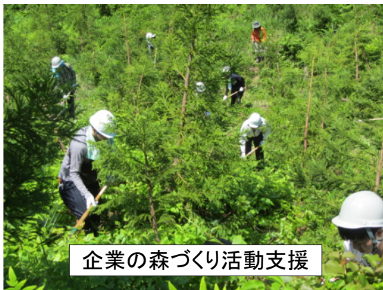
企業の森づくり活動支援