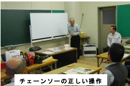
チェーンソーの正しい操作

○ 森づくり活動に必要な技能、安全なチェーンソー操作技術を身につける。(写真はH26のもの)