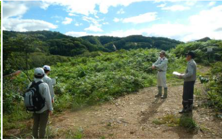
人の伐採利用から発生した里山二次林