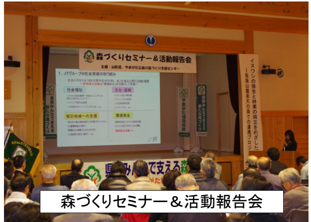
森づくりセミナー&活動報告会