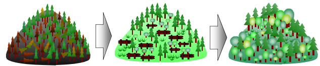
～自然生態系が豊かで公益的機能が高度に発揮される森林へ～

やまがた緑環境税による整備 森林整備 10ha 3,703千円（うち 税3,703千円）