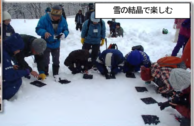
雪の結晶で楽しむ

自然環境教育指導者を養成する講座を、春（5月）、秋（11月）、冬（2月）の3回（計6日）、金山町：遊学の森で開催した。参加者は各回20～30名程度にのぼり、20代から70代まで幅広い年齢層の方に足を運んでいただいた。春と秋の講座では動植物の基礎知識、ネイチャーゲームの活用法、野外活動における緊急処置法などを学び、冬の講座では冬の伝統工芸や雪の性質について学んだ。