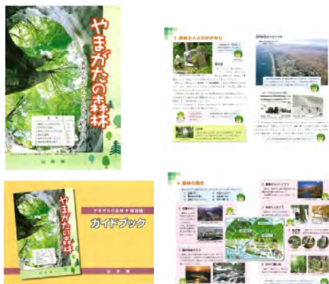
(副教材・ガイドブック)