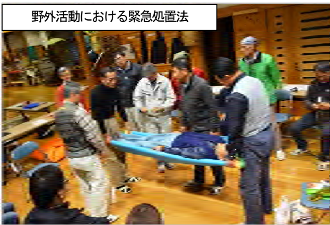
野外活動における緊急処置法