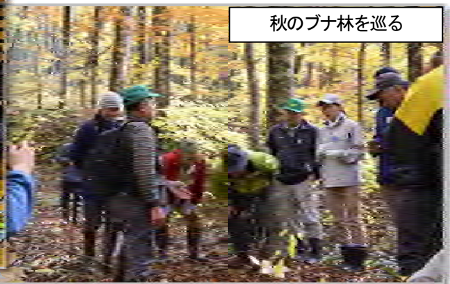
秋のブナ林を巡る