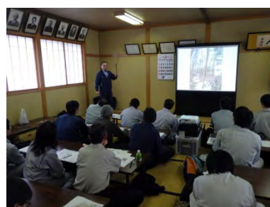
松くい虫防除研修