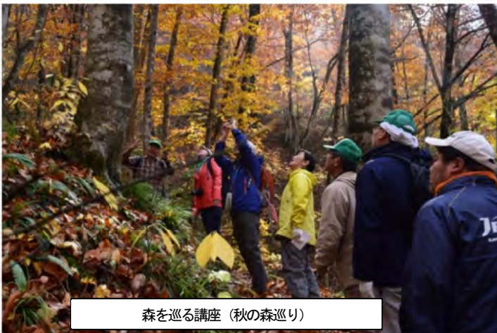
森を巡る講座（秋の森巡り）