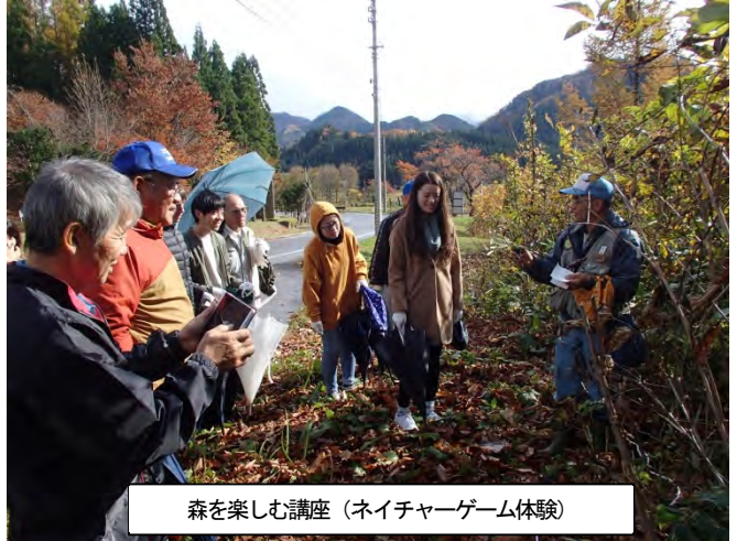
森を楽しむ講座（ネイチャーゲーム体験）