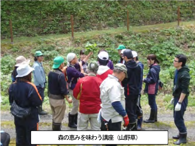
森の恵みを味わう講座（山野草）