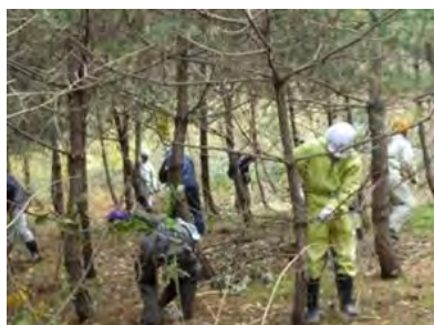
森林整備ボランティア 砂防林を育てよう