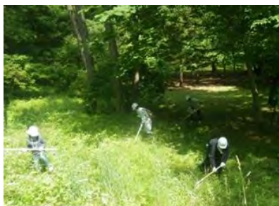
光ヶ丘松林整備 ボランティア