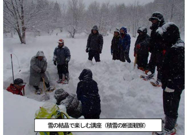
雪の結晶で楽しむ講座（積雪の断面観察）