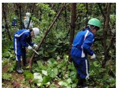
酒田一中 枝打ち体験活動