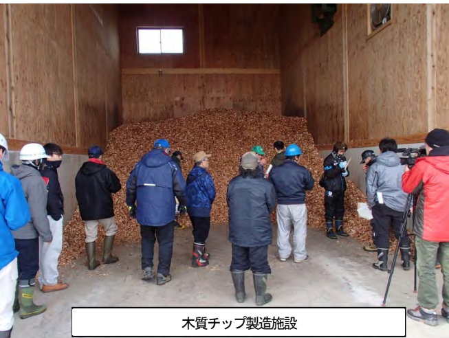
木質チップ製造施設