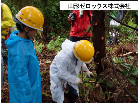
山形ゼロックス株式会社