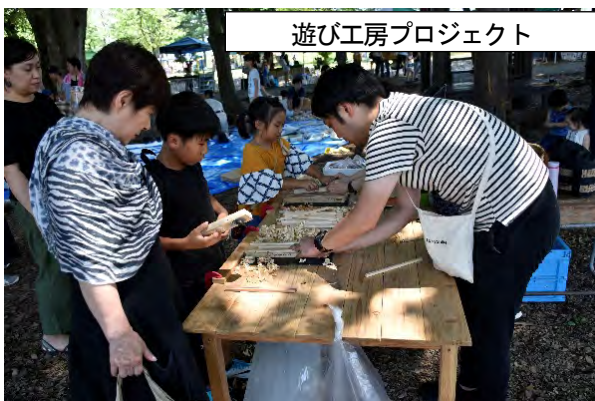
遊び工房プロジェクト