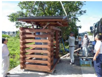
ゴミ集積施設の組立

市有林の間伐材でゴミ集積施設の組み立てキットを製作し、住民と協働で組立・設置し、地域材の利用意義等の学習会を実施。