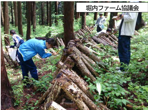
堀内ファーム協議会