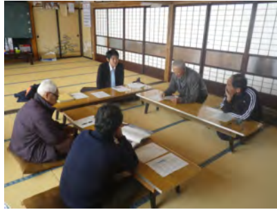
安全講習・意見交換

野生鳥獣と共存するため、地域住民と協働で下刈を行い、バッファゾーンを整備。また下刈の安全を確保するため下刈安全講習会も実施。