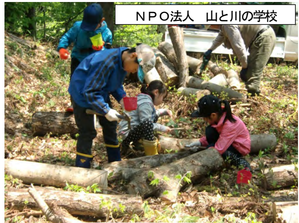
NPO法人 山と川の学校