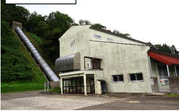
現在の倉沢発電所