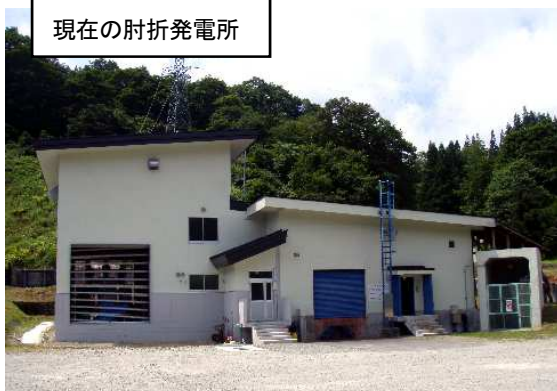
現在の肘折発電所