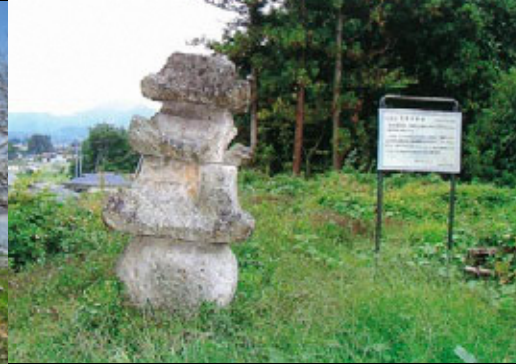
⑰ 北原の層塔 きたはら そうとう

天童市川原子の谷地中集落入口にある水晶山の鳥居。鎌倉時代の作で凝灰岩の石柱、高さ2.25メートル周囲2.9メートルで笠木も島木も抜穴もありません。伝説に、追手から逃れる義経の安泰を願った弁慶の一夜造りの鳥居が、夜が明け未完となったとあります。天童市指定有形文化財です。春には桜が咲き誇り、また違った表情を楽しめます。