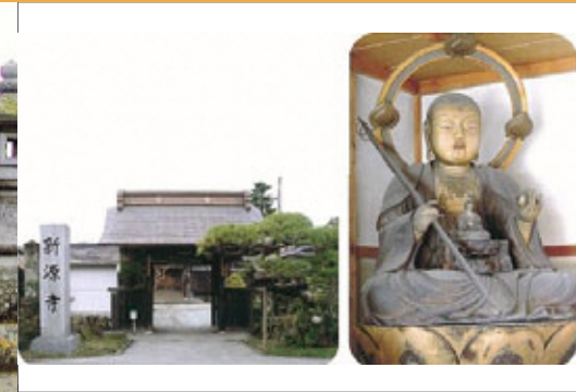
しんげんじ でんしょうぐんじょうだいぼさつぞう ② 新源寺と伝勝軍地蔵大菩薩像