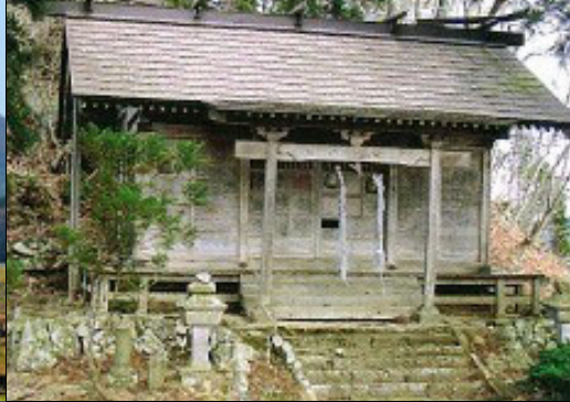
⑳ 水晶山神社 すいしょうざんじんじや

天童市と東根市の境にある、標高667.9mの山で、大宝2年(702年)修験道の祖役小角が開山と伝わっています。かつては山岳信仰、修験の霊山として繁栄し、山頂に水晶山神社が鎮座しています。登山口駐車場にトイレがあり、1時間前後で登頂、気軽に楽しめる里山、健康増進の里山として人気があります。