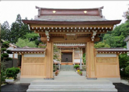
⑬ 高瀧山 光明院 こうりゅうざん こうみょういん

寛文元年(1661年)に開山した曹洞宗の寺院で、ご本尊は釈迦牟尼仏。境内の池の中に白雲大龍神を祀った龍神堂があり、早魃の時には雨乞い祈願が行われていましたが、近年は諸願成就の神として参詣する人も多くいます。山形十三仏霊場第三番文殊菩薩札所にもなっています。