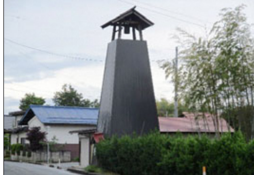
どうまん ひ みやぐら ③ 道満の火の見櫓

若木山扶桑林新源寺は延宝2年(1674年)開山の曹洞宗寺院で、本尊は釈迦牟尼仏。本堂に最上義光ゆかりの伝勝軍地蔵大菩薩像(延命地蔵)が祀られています。この像は最上義光が天童の舞鶴山に創建した愛宕神社の宿院大輪寺の本尊ですが、明治26年縁あって当寺に寄進されました。