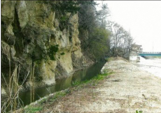
⑮ 横内堰 よこうちせき

天童市山口の上山口集落の東端にある赤い鳥居から2.5kmの山中に雨呼山を源流とする滝があり、この滝が高瀧山不動尊です。落差10数メートルあり、正面に不動尊、右に阿弥陀如来が祀られています。神亀元年(724年)僧行基が開眼と伝わっています。