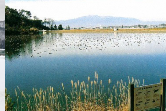
ぼらざきぬま ⑧ 原崎沼