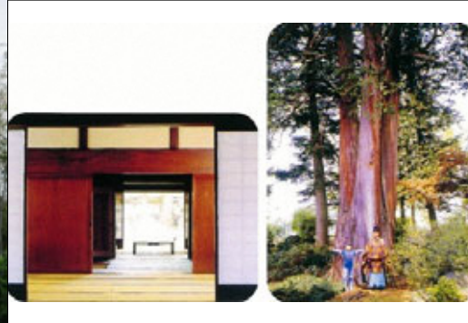
ごとうひさおけじゅうたくさんこう ④ 後藤寿夫家住宅と三光ヒバ