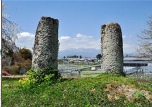
⑯ 谷地中の石鳥居 やちなか いしとりい

江戸時代の村絵図に乱川と押切川を結ぶ堰が関山街道に沿うように描かれています。大勢の関係者の努力により維持管理され、農業生産の役割を果たしております。※地図中に青線で印してあります。