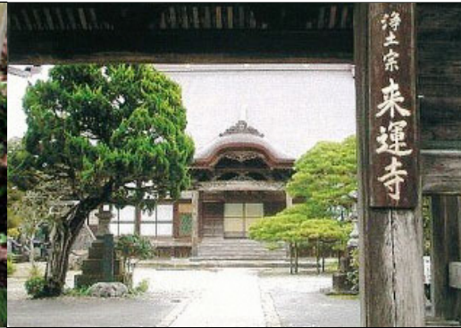
⑪ 宝珠山狐原院 来運寺 ほうじゅざん こげんいん らいうんじ

下山口の妙見神社入口の階段を登り切って右に10数メートル行った先に、べんべこ太郎という犬の墓があります。べんべこ太郎はこの地方に伝わる伝説の主人公で、若い娘を人身御供として要求する古狸の群れを退治し、自らも大怪我をし、妙見神社の所で息絶えてしまったといわれています。命を懸けて村人を救った犬の墓には、今も地区の人や多くの愛犬家が参拝に訪れています。