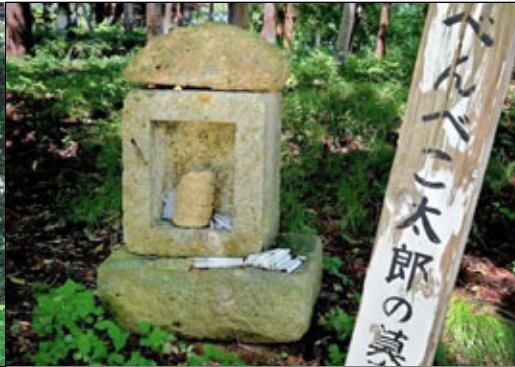
⑩ べんべこ太郎の墓 たろう はか

天童市山口の下山口集落西にある神社。押切川に突き出た丘の森の中にあり、下山口集落の鎮守の神様として崇敬されています。この境内は天正12年(1584年)最上義光に敗れた天童頼久の家臣、浅岡大炊助の楯跡だったため、浅岡氏の氏神だったとみられています。祭神は天御中主神で、祭礼日は以前7月19日、9月19日でしたが、現在は10月第二日曜日となっています。