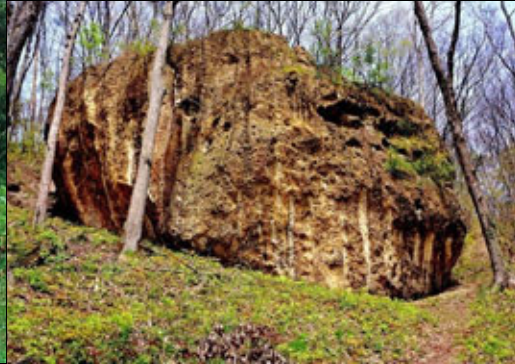
⑱ 雨滴岩 あまだれいわ

天童市川原子の谷地中北原の八幡神社裏手にあり、中世後期の作で高さ2.35メートル、台座の上に五輪塔の水輪のような初層があり、その上に三重の層塔があります。地元では大学檀と呼び、慶長年間(1596~1615年)に最上義光が地元の領主佐藤大学の供養の為に建てたと伝わっています。