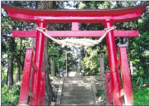
⑨ 妙見神社 みょうけんじんじや

天童市山口の下山口集落西にある神社。押切川に突き出た丘の森の中にあり、下山口集落の鎮守の神様として崇敬されています。この境内は天正12年(1584年)最上義光に敗れた天童頼久の家臣、浅岡大炊助の楯跡だったため、浅岡氏の氏神だったとみられています。祭神は天御中主神で、祭礼日は以前7月19日、9月19日でしたが、現在は10月第二日曜日となっています。