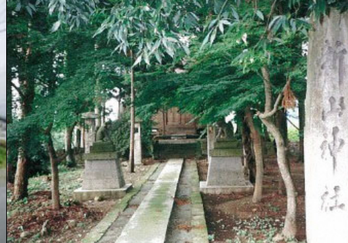
しんざんじんじゃ ⑥ 新山神社