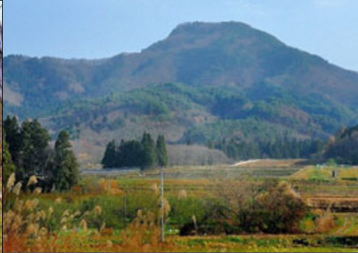
⑲ 水晶山 すいしょうざん

天童市川原子の谷地中集落の裏山を20数メートル登った所にある大岩が雨滴岩です。石英粗面岩で高さが17メートル、周囲60メートルで、雨の滴で削られたような文様があるところから雨滴岩と言われ、近くの常楽寺の山号にもなっています。またこの文様は、弁慶が馬に跨り登ろうとしてきた馬の蹄の痕跡等の伝説が残っています。往時には、岩上に多聞天が祀られていたということです。