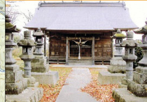
かすがじんじゃ ① 春日神社