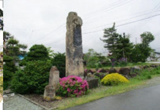
やまぐち おおぼとけ ⑤ 山口の大仏