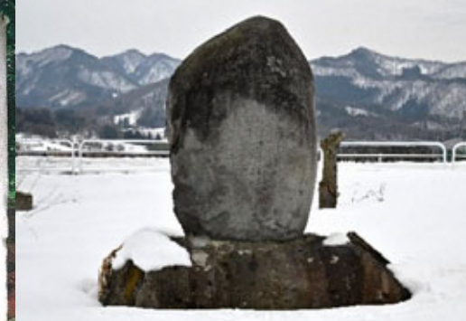
やまぐちむらかいでんきねんひ ⑦ 山口村開田記念碑