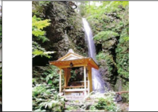
⑭ 高瀧山不動尊 こうりゅうざんふどうそん