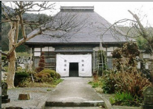
⑫ 羽黒山 龍源寺 はぐろさん りゅうげんじ